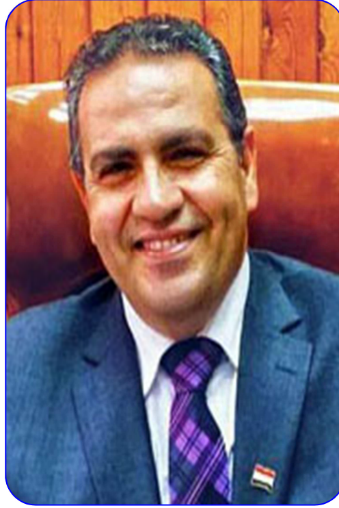
أ.د/ محمد حسن القناوي رئيس الجامعة