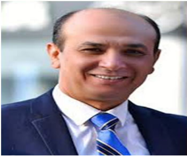
أ.د/ طارق مصطفى غلوش نائب رئيس الجامعة لشئون الدراسات العليا والبحوث