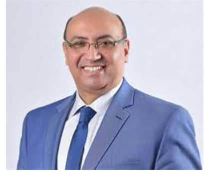
أ.د/ محمد عطية البيومى نائب رئيس الجامعة لشئون التعليم والطلاب