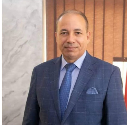
أ.د/ شريف يوسف خاطر رئيس الجامعة