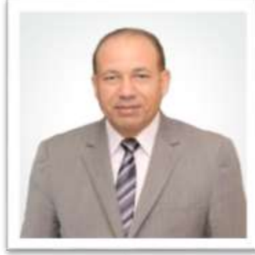
الأستاذ الدكتور / شريف يوسف خاطر رئيس الجامعة