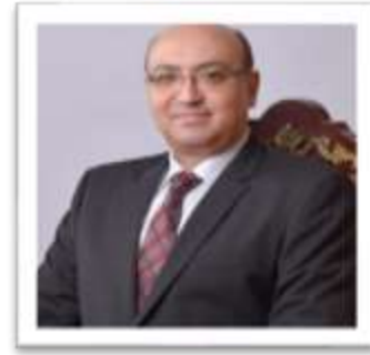
الأستاذ الدكتور / محمد عطيه البيومي نائب رئيس الجامعة لشئون التعليم والطلاب