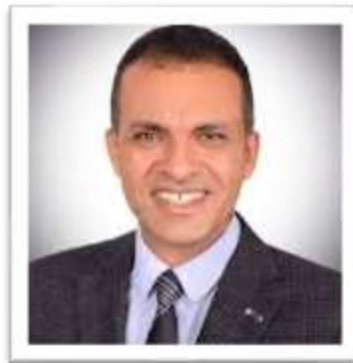
الأستاذ الدكتور / محمد عبدالعظيم نائب رئيس الجامعة لشئون خدمة المجتمع وتنمية البيئة