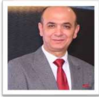
الأستاذ الدكتور / طارق مصطفى غلوش نائب رئيس الجامعة لشئون الدراسات العليا والبحوث